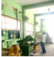
Gambar 6 pembersihan dinding dan atap