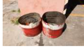
Gambar 8 bak sampah

Langkah selanjutnya menyediakan bak sampah untuk bengkel AKSI yang sebelumnya di bengkel sendiri tidak menyediakan bak sampah. Dan penyediaan bak sampah ini ada dua jenis yang pertama bak sampah untuk sampah bahan dan yg kedua untuk sampah makanan dan minuman. adapun dukumentasi berupa foto bak sampah sebagai berikut: