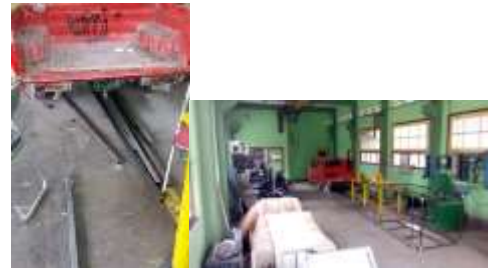
Gambar 2 bahan yang di area kerja

Belum tertatanya area kerja membuat tempat menjadi tidak nyaman dan rawan kecelakaan, seperti bahan yang berserakan di area kerja dan tidak ada pembatas untuk area kerja. Ini bisa berdampak terjadinya kecelakaan kerja. Adapun dokumentasi berupa foto sebagai berikut: