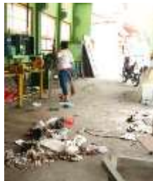
Gambar 7 pembersihan lantai

Jika pembersihan dinding sudah selesai sekarang lanjut ke langkah ke dua pembersihan lantai. Dan yang di bersihkan yaitu sampah makanan dan minuman yang berserakan di area kerja dan oli yang tumpah ke lantai. adapun dokumentasi berupa foto pembersihan lantai di bengkel sebagai berikut: