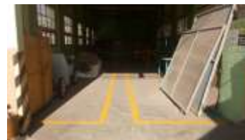
Gambar 9 garis batas area kerja

Penerapan garis tersebut berfungsi untuk mempertegas area kerja. Disamping itu juga berfungsi sebagai tanda batas mesin kerja yang berada di area kerja. Adanya dokumentasi berupa foto pembuatan garis-garis pada tempat kerja sebagai berikut: