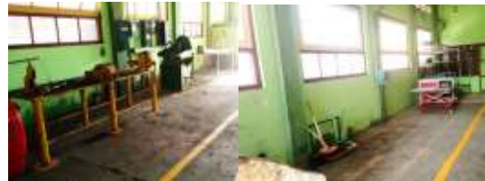
Gambar 5 Penerapan Rapi

Penataan dilakukan menurut frekuensi kebutuhan mesin, dan kebutuhan listrik yang memakai listrik atau tidak. Adapun dokumentasi berupa foto sebagai berikut: