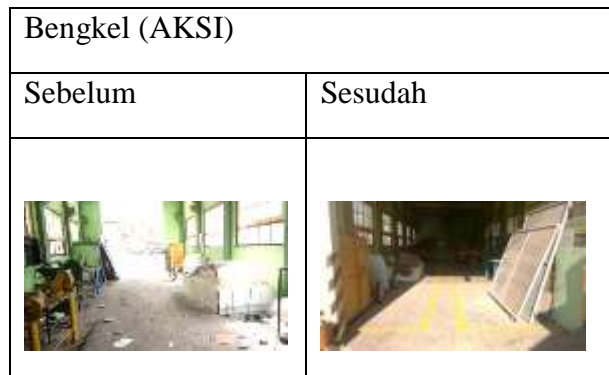
Tabel 4.5 Sebelum dan Sesudah penerapan 5R