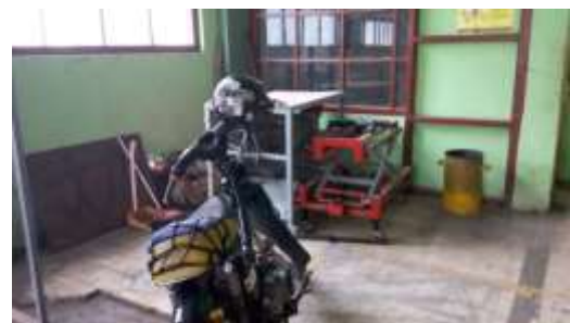
Gambar 3 kendaraan yang berada di area kerja