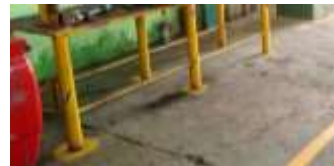
Gambar 10 garis batas mesin