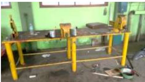
Gambar 1 meja cekam

Kebersihan pada mesin dan area kerja kurang terjaga seperti meja cekam yang kotor karena setelah digunakan tidak langsung dibersihkan, dan tidak adanya bak sampah membuat area kerja menjadi kotor. Adapun dokumentasi berupa foto sebagai berikut: