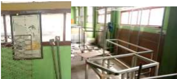
Gambar 4 penerapan ringkas

Peralatan yang kondisinya tidak layak pakai diberi label hijau supaya peralatan tersebut tidak bercampur lagi dengan peralatan yang di gunakan. Adapun dokumentasi berupa foto sebagai berikut: