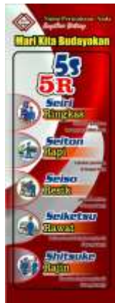
Gambar 11 slogan 5R

(pembiasaan).Setelah keempat “R” sebelumnya sudah terlaksana dengan baik tentunya diperlukan “R” selanjutnya yaitu rajin atau pembiasaan.Dalam penerapan rajin tersebut ada 2 yg perlu memenuhi indikator pelaksanaannya yaitu mengeritik mahasiswa agar mebudayakan 5R dan pameran foto sebelum dan sesudah menerapkan 5R.adadokumentasi slogan dan foto-foto sebelum dan sesudah sebagai berikut: